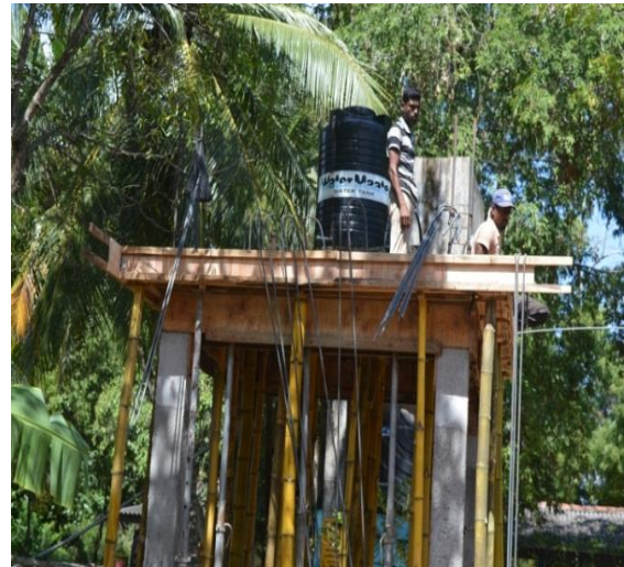
අ/ සුබෝධි මහා විද්‍යාලය සඳහා ජල කුළුණක් ඉදිකිරීම